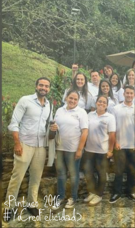
<Pintuco 2016 #YaCreoFelicidad>