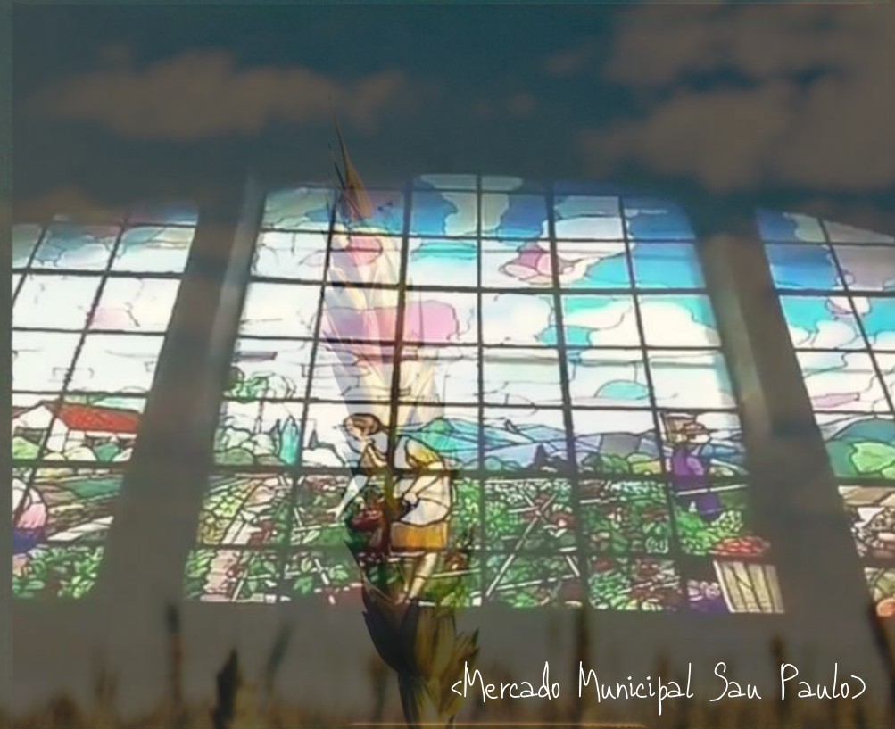
<Mercado Municipal San Paulo>