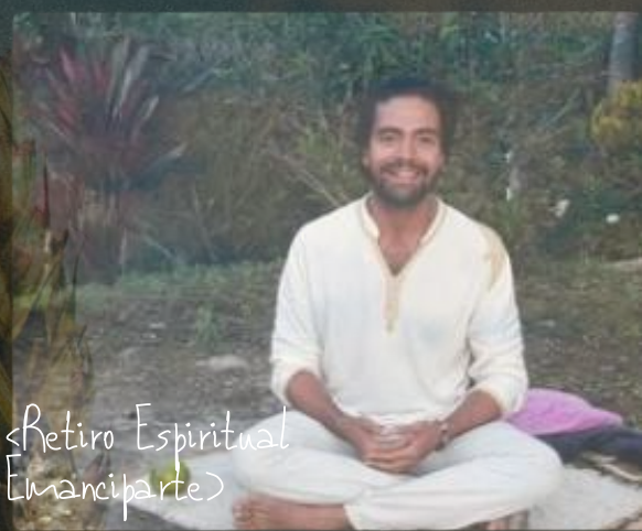
«Retiro Espiritual Emanciparte»