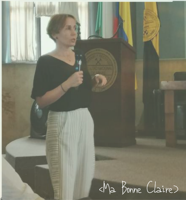
<Ma Bonne Claire>