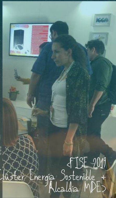
<FISE 2019 Alcaldía MDE>