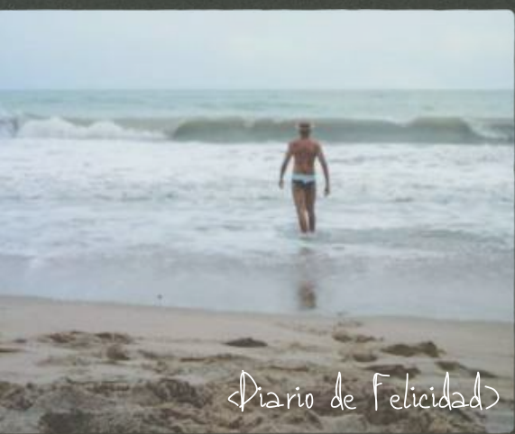
«Diario de Felicidad»