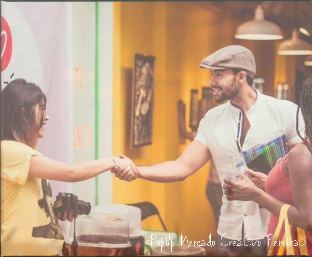
<PopUp Mercado Creativo Pereira>