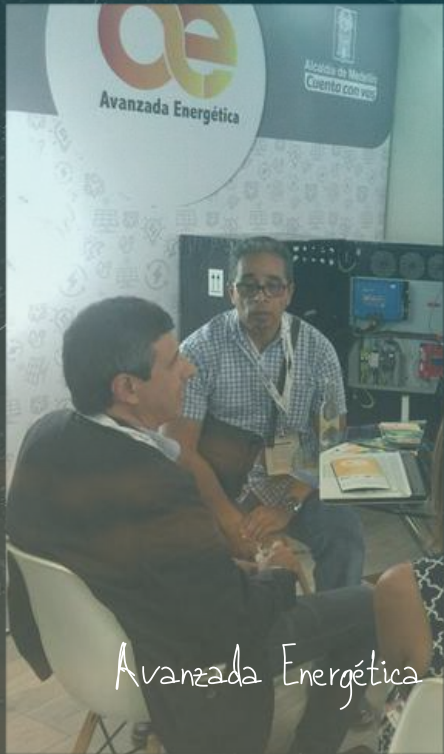
Avanzada Energética + Cluster Energía Sostenible + Alcaldía MDE