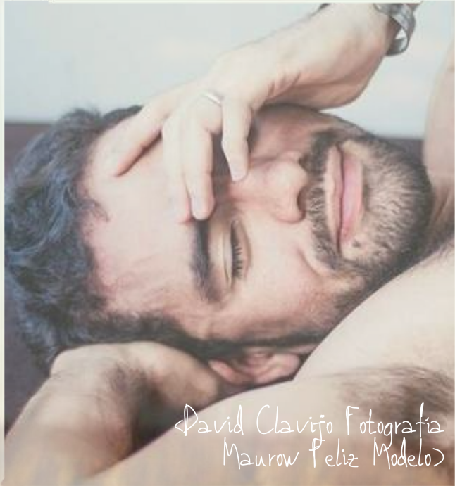
Maurou Feliz Modelo